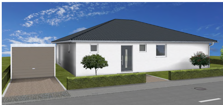
Eingang Nordansicht (Garage ist Sonderwunsch)